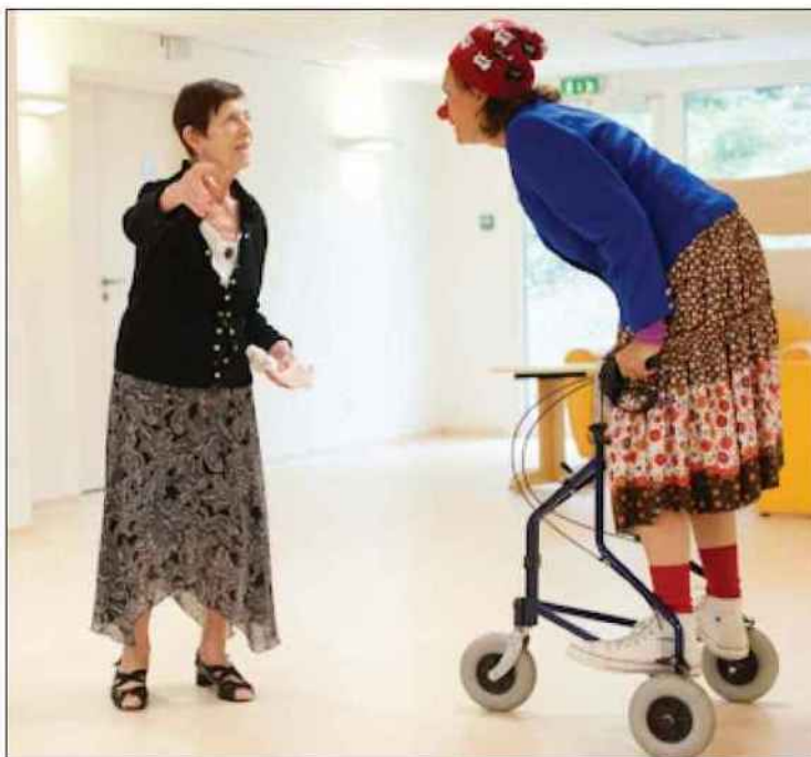
Intervention en gériatrie : « On vient réveiller la vie, malgré la maladie, le grand âge... »

tes ou une demi-heure, être une grosse fête où le lit se transforme en fusée ou en toboggan, ou bien un moment de douceur. On fait souffler un vent frais on met la maladie entre parenthèses.»